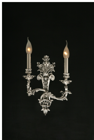
Applique 2 luci in fusione artistica di ottone - 12.229/2 - Gold Light And Crystal - Arredoluce