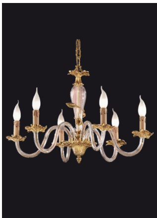
Lampadario 6 luci cristallo e fusione di ottone - 12.260/6 - Gold Light and Crystal - Arredo Luce