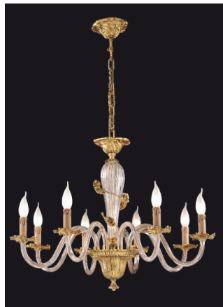
Lampadario 8 luci cristallo e fusione di ottone - 12.261/8 - Gold Light and Crystal - Arredo Luce