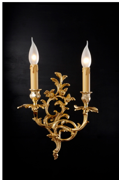
Applique 2 luci in fusione artistica di ottone - 12.228/2 - Gold Light And Crystal - Arredo Luce