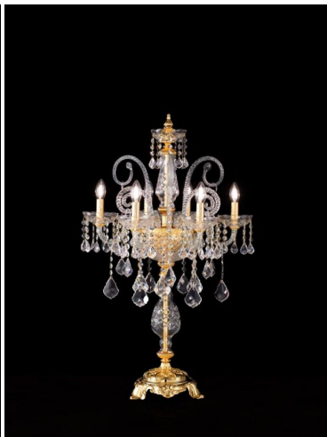
Arredoluce Luxury Crystal Lampada tavolo 6 luci 584/L6