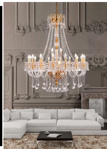
Arredoluce Luxury Crystal Lampadario 16 luci - 582/16