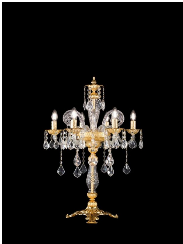
Arredoluce Luxury Crystal Lampada tavolo 6 luci 585/L6