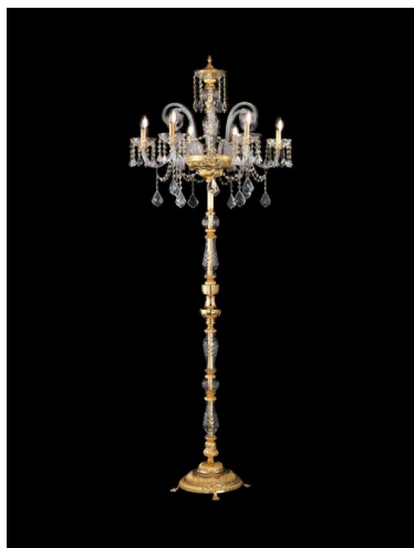
Arredoluce Luxury Crystal Lampada da terra 6 luci 586/P6