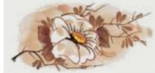
15. DEC. ROO Filo marrone Brown outline