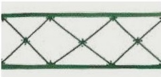
27. DEC. RMV Filo verde prato Grass green outline