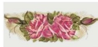
42. DEC. MOR Filo verde marcio Grubby green outline