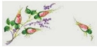
05. DEC. RRR Filo rosso Red outline