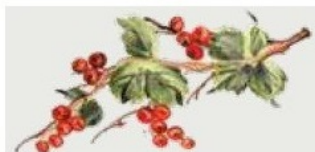
46. DEC. RIB Filo verde prato Grass green outline