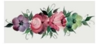
11. DEC. OTT Filo verde prato Grass green outline