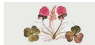
43. DEC. TRS Filo verde marcio Grubby green outline