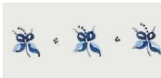
38. DEC. SOB Filo blu Blue outline