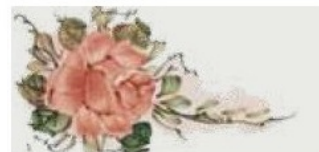
55. DEC. BUS Senza filo colorato Without colour outline