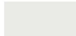
02 Lucido Glossy