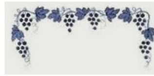
08. DEC. LOB Filo blu Blue outline