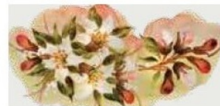
56. DEC. FAR Filo marrone della tonalità del decoro Brown outline of the tonality of decoration