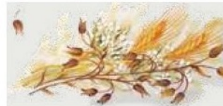
29. DEC. AVS Filo verde prato Grass green outline