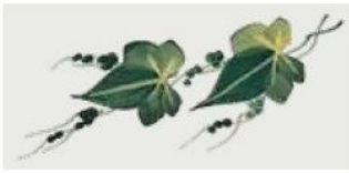
04. DEC. UOO Filo verde prato Grass green outline