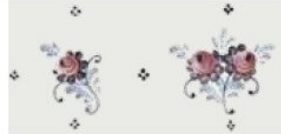
17. DEC. PEO Filo blu Blue outline