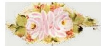
57. DEC. PRO Filo verde della tonalità del decoro Green outline of the tonality of decoration