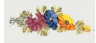
19. DEC. DMI Filo marrone Brown outline