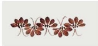
28. DEC. WOM Filo marrone Brown outline