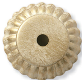
BO - Bianco sfumato oro White gold