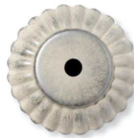
BA - Bianco sfumato argento White silver