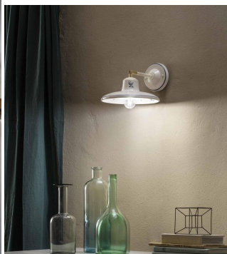
Ferroluce Classic Como applique 1 luce C2332