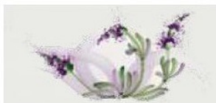
69. DEC. LAV Filo viola della tonalità del decoro Violet outline of the tonality of decoration