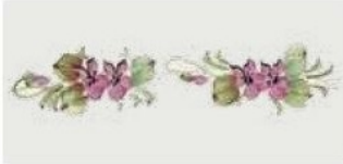
13. DEC. COO Filo verde marcio Grubby green outline