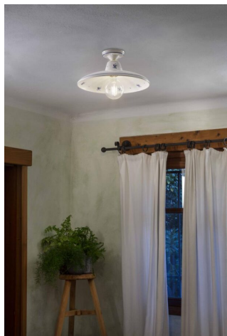
Ferroluce Classic Como plafoniera 1 luce C2333