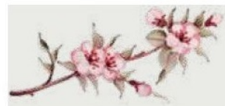
70. DEC. FDP Filo marrone della tonalità del decoro Brown outline of the tonality of decoration