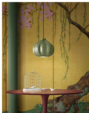
Ferroluce Decò Afoxè sospensione 1 luce C2641