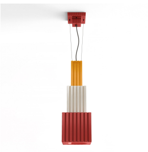
Ferroluce Decò Metra - Lampada a sospensione C2832