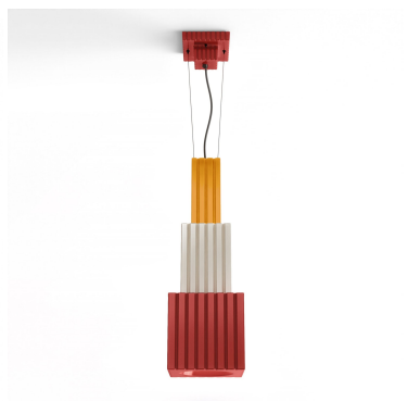
Ferroluce Decò Metra - Lampada a sospensione C2830