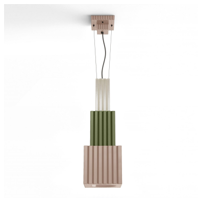
Ferroluce Decò Metra - Lampada a sospensione C2831