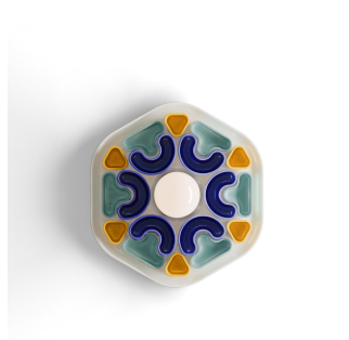
Ferroluce Decò Phytia - Lampada da parete in ceramica colorata C2801