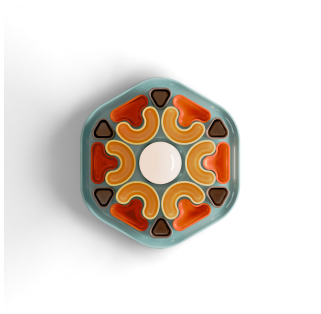
Ferroluce Decò Phytia - Lampada da parete in ceramica colorata C2800