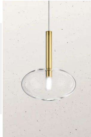
Il Fanale - Alchimia 277.04 | Lampada a sospensione in vetro Ø21,5 cm