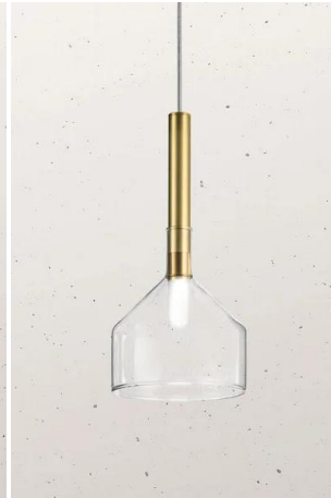
Il Fanale - Alchimia 277.02 | Lampada a sospensione in vetro Ø15 cm