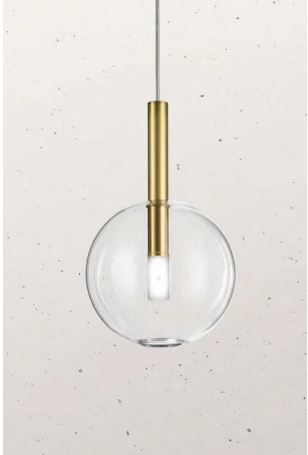
Il Fanale - Alchimia 277.06 | Lampada a sospensione in vetro Ø 18 cm