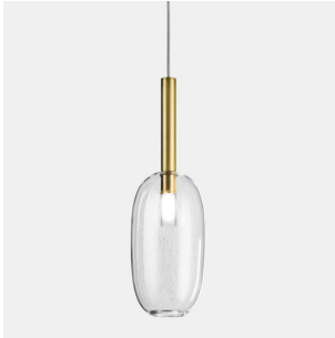
Il Fanale - Alchimia 277.05 | Lampada a sospensione in vetro Ø 12