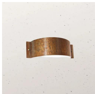
Il Fanale Decori applique per esterno 252.02