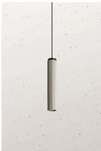
Il Fanale - Dune sospensione 1 luce diam.8 cm