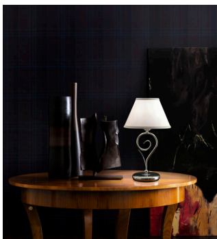
Lampada 1 luce cromo -801/L1 - Euroluce - Arredo luce