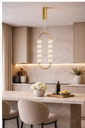
Maytoni Amulet lampada a sospensione 16W