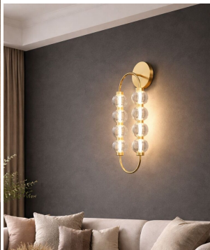
Maytoni Amulet lampada da parete oro Led 16W