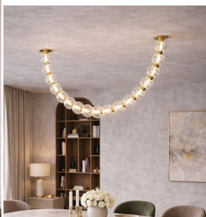
Maytoni Amulet plafoniera