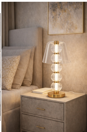
Maytoni Amulet - Lampada da Tavolo