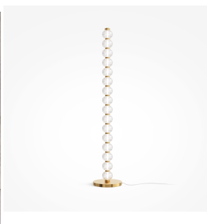
Maytoni Amulet Lampada da Terra Oro LED