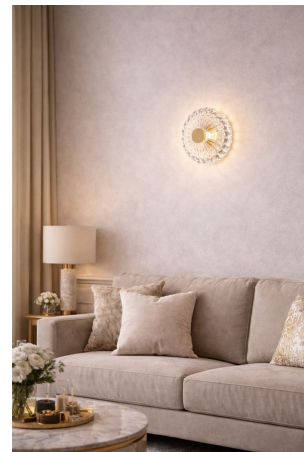
Maytoni Amulet - Lampada da Parete Ø18 cm