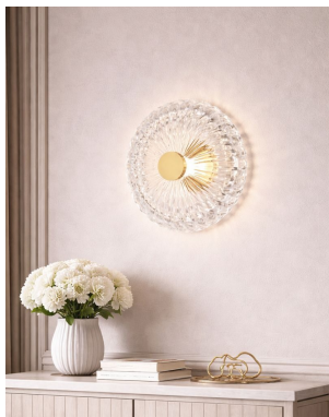
Maytoni Amulet - Lampada da Parete Ø35 cm