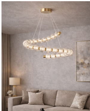
Maytoni Amulet lampada a sospensione Ø 80