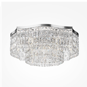
Maytoni Dune plafoniera 10 luci - cromo