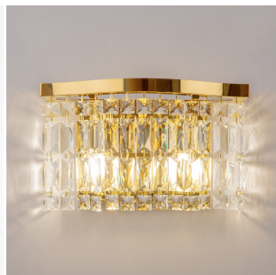
Maytoni Dune lampada da parete - oro