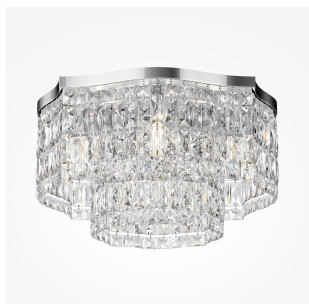
Maytoni Dune plafoniera 6 luci - cromo