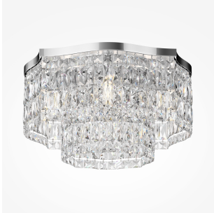
Maytoni Dune plafoniera 6 luci - cromo