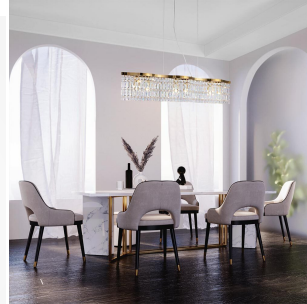
Maytoni Dune Lampada a Sospensione Oro 6 Luci