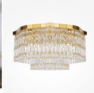
Maytoni Dune plafoniera 6 luci - oro