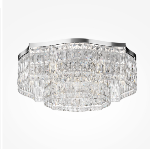
Maytoni Dune plafoniera 10 luci - cromo