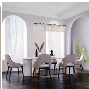
Maytoni Dune Lampada a Sospensione Oro 6 Luci