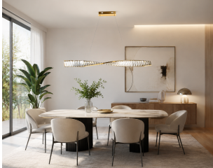
Maytoni Krone Lampada a Sospensione LED 100 cm