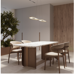
Maytoni Krone Sospensione LED Ottone 36W 3000K