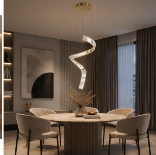
Maytoni Krone Lampada a sospensione verticale