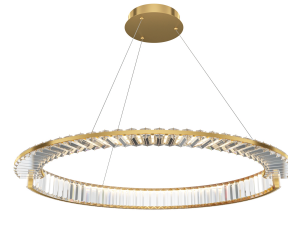
Maytoni Krone Lampada a Sospensione LED Ø80