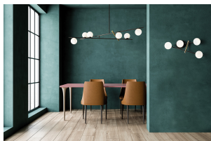
Miloox Kika sospensione 6 luci