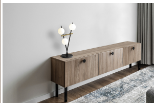
Miloox Kika Lampada da Tavolo 3 luci