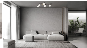
Miloox Kika plafoniera 5 luci