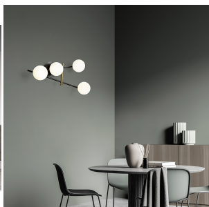
Miloox Kika applique 4 luci