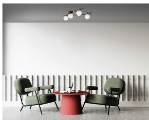
Miloox Kika plafoniera 4 luci