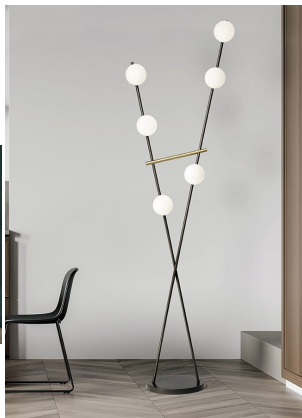
Miloox Kika Lampada da terra 6 luci