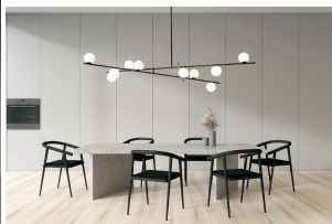
Miloox Kika sospensione 10 luci