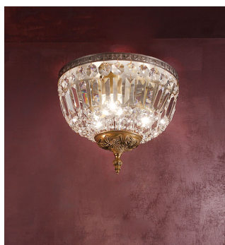
Plafoniera 3 luci bronzo e cristallo - 540/PL30 - Luxury Crystal - Arredoluce