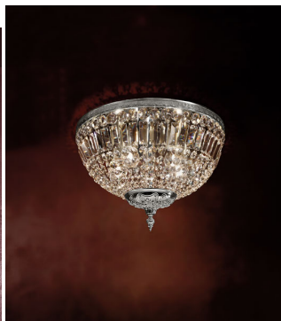
Plafoniera 5 luci cromo e cristallo - 540/PL45 - Luxury Crystal - Arredoluce