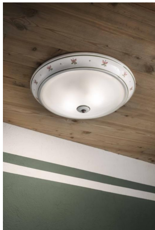
Plafoniera Capua C 113 Ferroluce