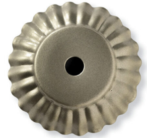
AG - Argento Silver