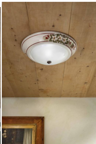
Plafoniera Capua C 112 Ferroluce