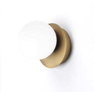
Vivida International Pearl applique 0099.10