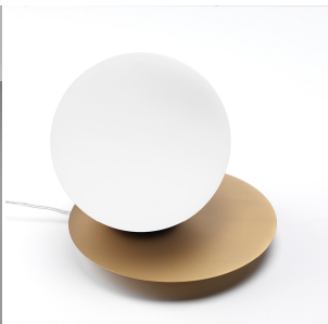
Vivida International Pearl lampada tavolo 0099.42