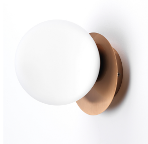
Vivida International Pearl applique 0099.11