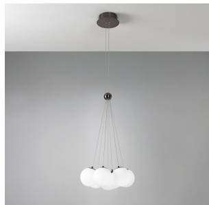
Vivida International Pearl lampada a sospensione 0099.30