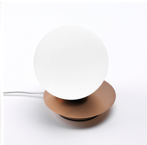
Vivida International Pearl lampada tavolo 0099.41